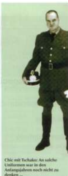
Chic mit Tschakan: An solche Uniformen war in den Anfangsjahren noch nicht zu denken...