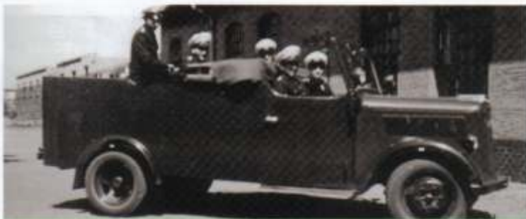
Mannschaftswagen im Cabrio-Look

6.000 Polizisten in Essen und fordern stürmisch eine Verbesserung ihrer Situation. Verbissene Verhandlungen folgen, bis endlich, Anfang April 1953 auf dem 4. Delegiertentag, Innenminister Dr. Franz Meyers die zwei Hauptforderungen des Landesbezirks anerkennt und anschließend auch erfüllt: die finanzielle Verbesserung der Gehälter und die Verstaatlichung der Polizei. Kurz darauf werden die Grundgehälter für Polizisten um noch einmal 20 Prozent angehoben. Der 1. Oktober 1953 ist der Geburtstag der staatlichen Polizei in Nordrhein-Westfalen.